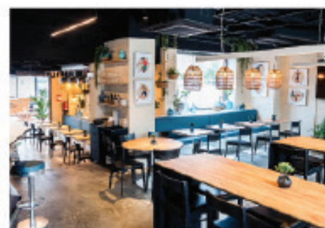
GASTROBAR CAL BLAY CAMP NOU BARCELONA