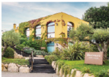
MIRADOR DE LES CAVES SUBIRATS