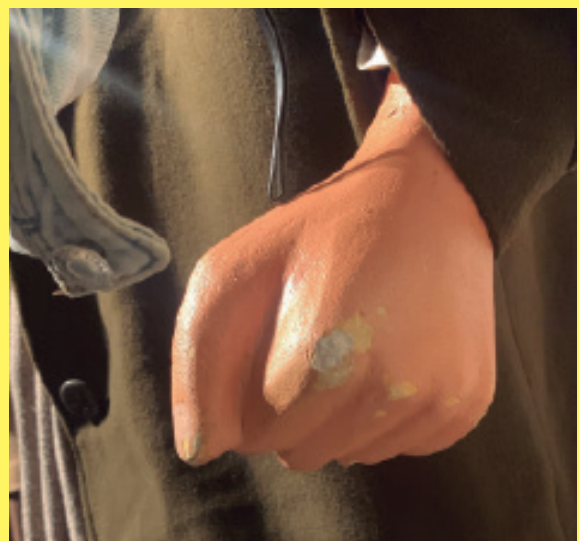
Ma de Modest Casanovas