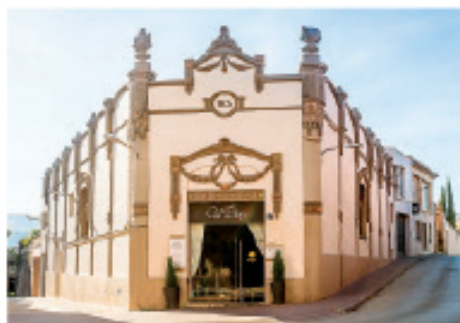
CAL BLAY VINTICINC SANT SADURNÍ D'ANOIA