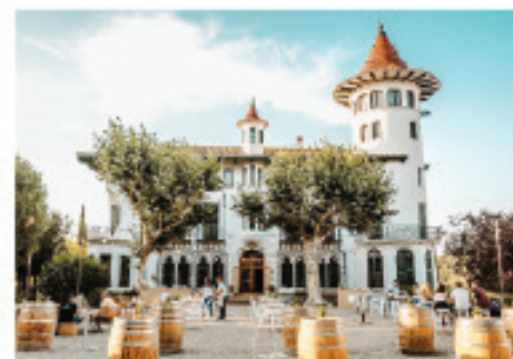
ELS JARDINS DE CODORNÍU SANT SADURNÍ D'ANOIA

674 345 232 - jardinscodorniu@calblay.com