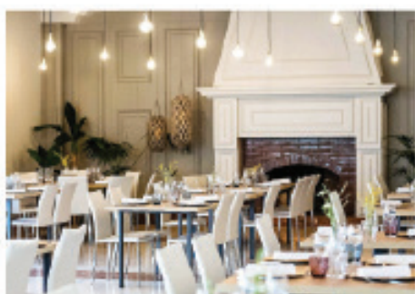
LA MASIA D'ESPLUGUES ESPLUGUES DE LLOBREGAT

674 345 232 - jardinscodorniu@calblay.com