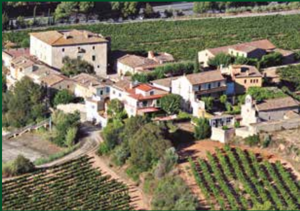
Poble medieval de Torre-Ramona

Torre-Ramona és un dels nuclis històrics més desconeguts del Penedès, format per un conjunt monumental, amb l'església romànica de Sant Joan Sesrovies, el palau fortificat d'estil gòtic renaixentista que dona nom al nucli i diferents edificis d'origen medieval, així com la seu de la Confraria del Cava Sant Sadurní.