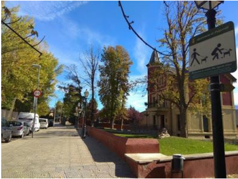
Escola de Música Issi Fabra

Continuem recte fins arribar a l'escola Alfons I, punt final de l'itinerari.