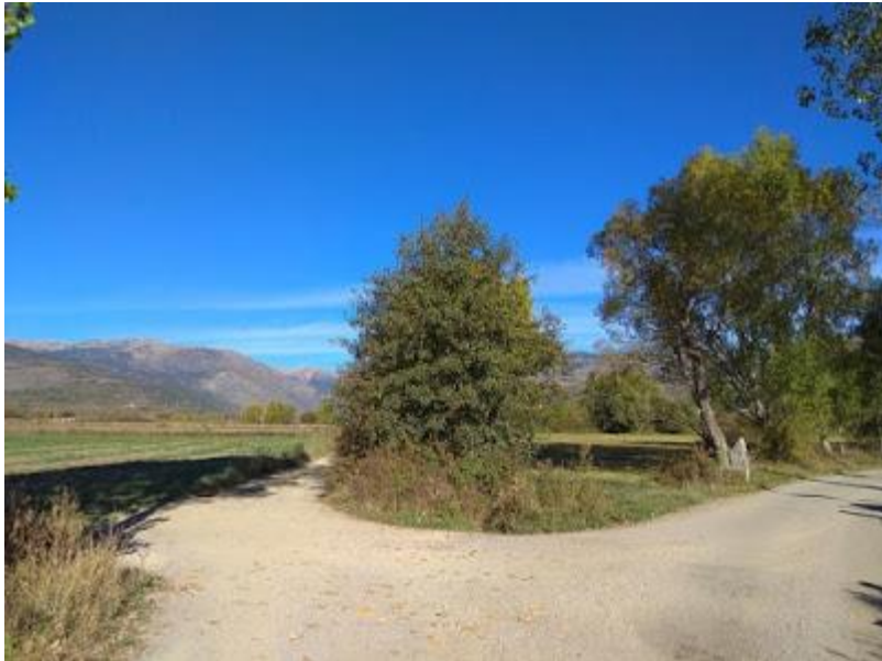
Intersecció. Senyal indicatiu (esquerra)

Seguim pel camí de terra fent cas dels senyals indicatius.