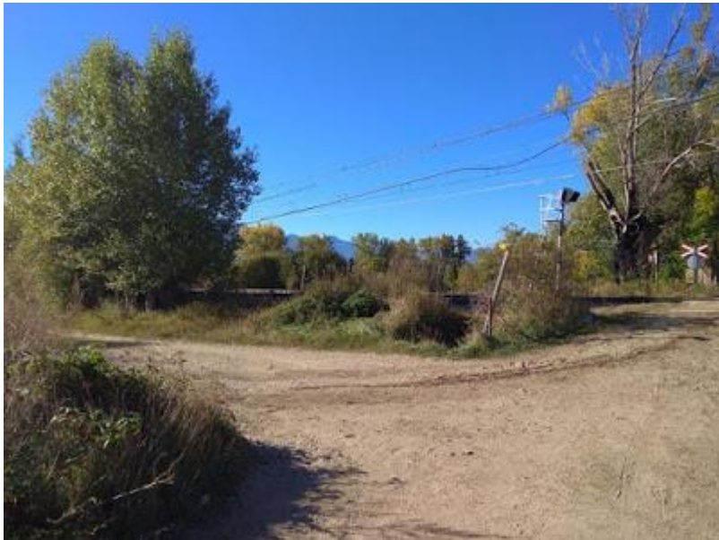
Via del tren. Desviament direcció Puigcerdà

Seguint el camí, uns 300 metres més enllà, arribem a la via del tren (pas a nivell). No la creuem. Continuem per l'esquerra, paral·lels a la via en direcció Puigcerdà.