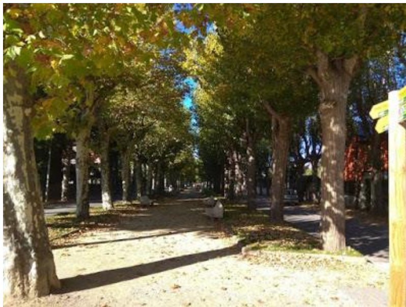
Passeig de la Sèquia

Iniciem l'itinerari en el passeig Pere Borrell davant de l'escola Alfons I , on trobem unes quantes senyals en un pal de la llum. Continuem pel passeig, en direcció a la plaça d'en Dionís Puig on girem a l'esquerra per seguir pel passeig de la Sèquia.