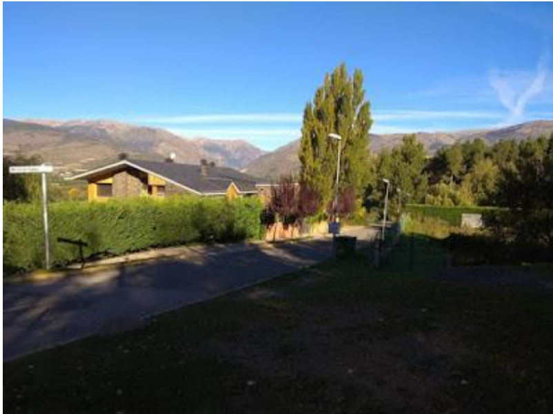
Inici camí d'Enveig

Continuem pel camí (asfaltat) i passem pel costat del Bosquet de Puigcerdà (ens queda a la nostra dreta. Seguim els senyals indicatius.