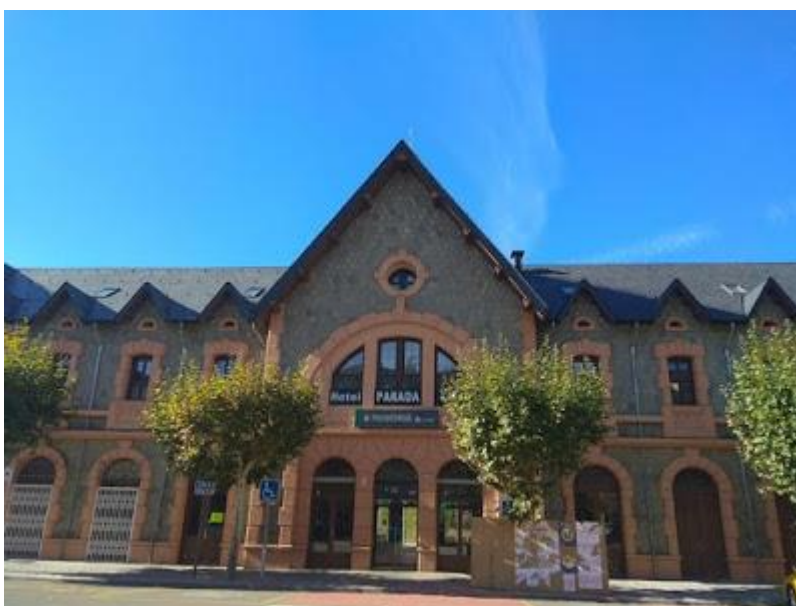
Estació de tren de Puigcerdà

Seguim pel carrer Pont de Sant Martí, després canvia de nom (carrer de l'Estació), en direcció a l'estació de tren de Puigcerdà. Ens trobem a l'estació de tren de Puigcerdà.