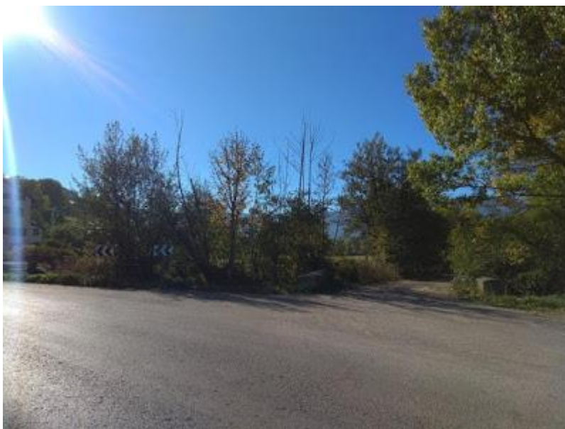
Desviament. Carrer paratge de Sant Martí

Continuem per camí de la Vinyola en direcció Puigcerdà. A 500 metres des del pas a nivell, trobem un desviament a la nostra dreta (camí de terra). Seguim per aquí en direcció al Pont de Sant Martí.