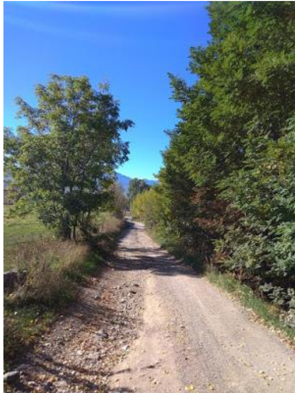
Paratge de Sant Martí

En el paratge de Sant Martí, també trobem senyals indicatius de l'itinerari.