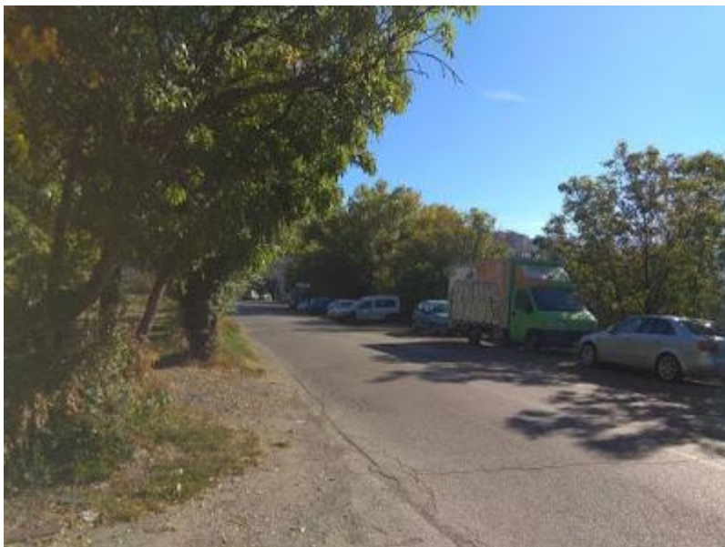
Carrer del Pont de Sant Martí

Arribem al final del Paratge de Sant Martí per continuar cap a l'esquerra pel carrer Pont de Sant Martí.