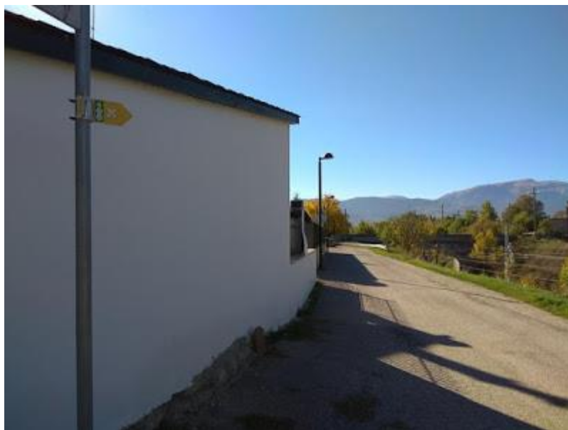
Senyal indicatiu. Paratge de Sant Martí

En el paratge de Sant Martí, també trobem senyals indicatius de l'itinerari.