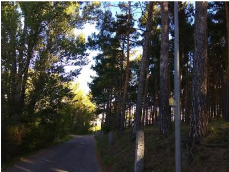
El Bosquet de Puigcerdà

Continuem pel camí (asfaltat) i passem pel costat del Bosquet de Puigcerdà (ens queda a la nostra dreta. Seguim els senyals indicatius.