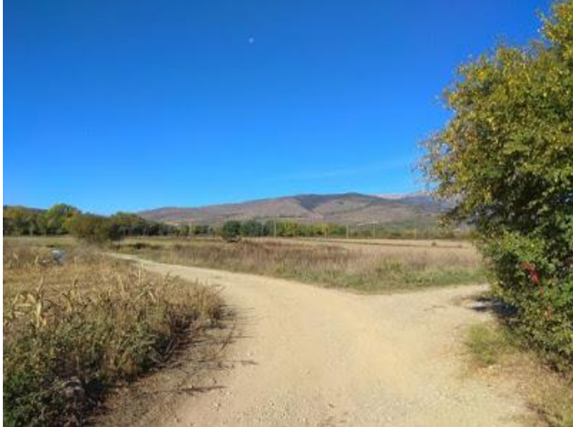
Intersecció. Senyal indicatiu (esquerra)

Seguint el camí, uns 300 metres més enllà, arribem a la via del tren (pas a nivell). No la creuem. Continuem per l'esquerra, paral·lels a la via en direcció Puigcerdà.