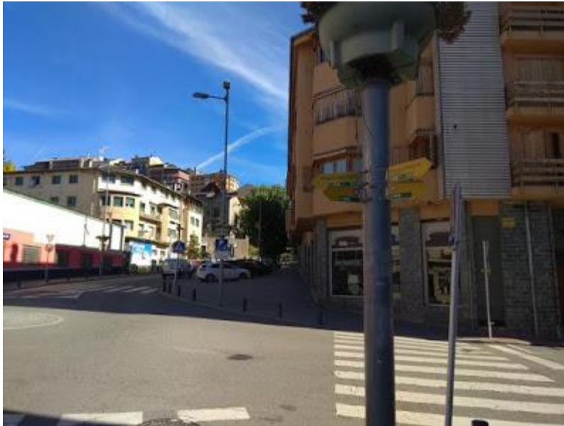
Rotonda avinguda de Catalunya amb avinguda dels Pirineus

Continuem l'itinerari pel mateix carrer de l'Estació fent cas dels senyals indicatius, fins arribar a la benzinera Repsol per trobar l'avinguda de Catalunya.