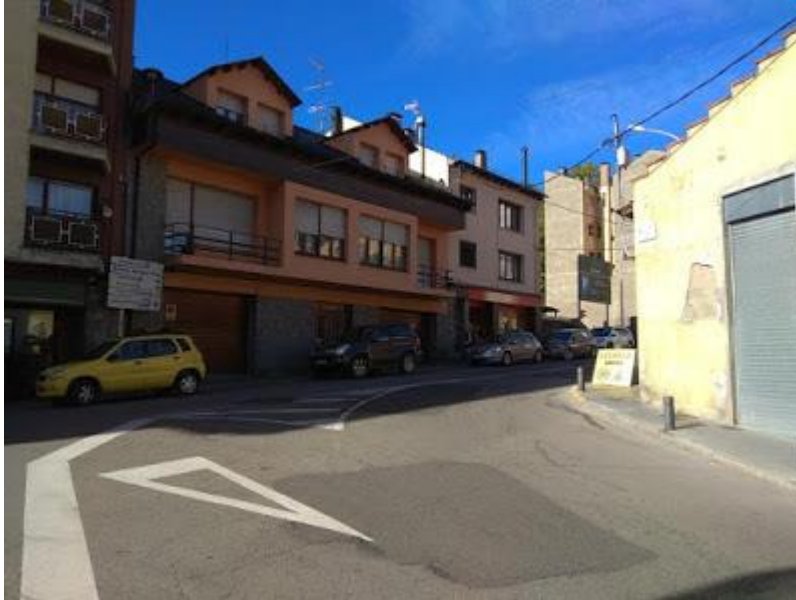
Avinguda del Coronel Molera

Seguint per l'avinguda de Catalunya, passem pel costat del Museu Cerdà. En aquesta alçada, l'avinguda canvia de nom i passa a ser carrer Higini de Rivera. Continuem fins arribar a l'avinguda Coronel Molera (davant trobem el supermercat Bonpreu). Girem a la dreta en direcció a la plaça de Barcelona.