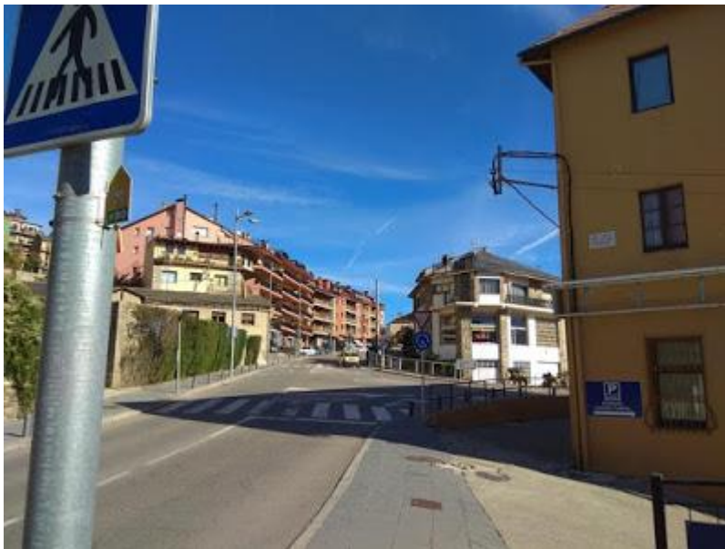
Avinguda de Catalunya

Iniciem la pujada per l'avinguda de Catalunya, té un desnivell suau però constant. Seguim recte passant per la rotonda on comença l'avinguda del Segre.