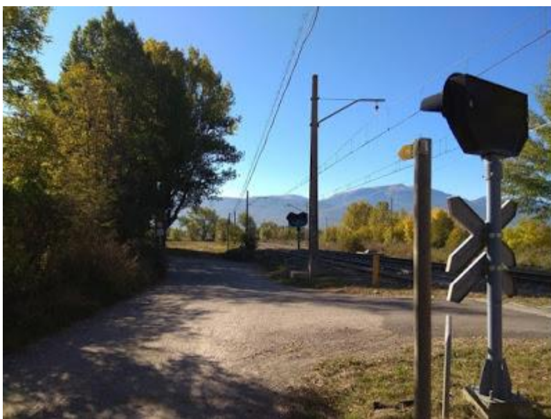
Pas a nivell. Camí de la Vinyola

Continuem per camí de la Vinyola en direcció Puigcerdà. A 500 metres des del pas a nivell, trobem un desviament a la nostra dreta (camí de terra). Seguim per aquí en direcció al Pont de Sant Martí.