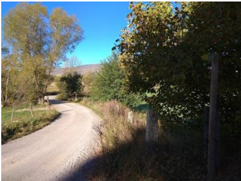
Senyal indicatiu. Camí d'Enveig

Uns 500 metres més avall, trobem un desviament amb un camí de terra a la dreta. Seguim baixant pel camí d'Enveig (asfaltat) fent cas dels senyals indicatius.