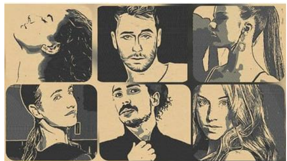
LA IM.PERFECTA CÍA DANSA

Més info: https://linktr.ee/laim.perfectadansa